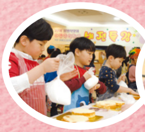
Mitt eget recept: "Älskvärd kaka"