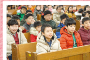
Mina drömmar och visioner: "Vad gör levitiska arbetare (församlingens heltidsarbetare)?"