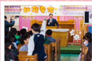
Att vara andligt vaken i den sista tiden! Be i fullhet!