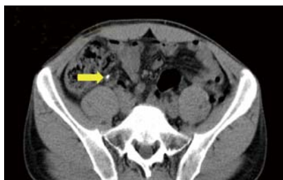
Efter bön, normal blindtarm