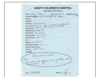
Gumaling ang kanser ayon sa pagsusuri