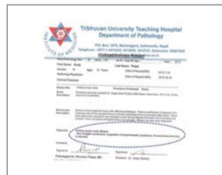
Nakita sa pagsusuri na may malalang lymphoma ang anak ko (third stage)

Nagpapasalamat at niluluwalhati ko ang buhay na Diyos na nagbigay ng pagkakataong maligtas ang pamilya ko dahil sa naging karamdaman ng anak ko.