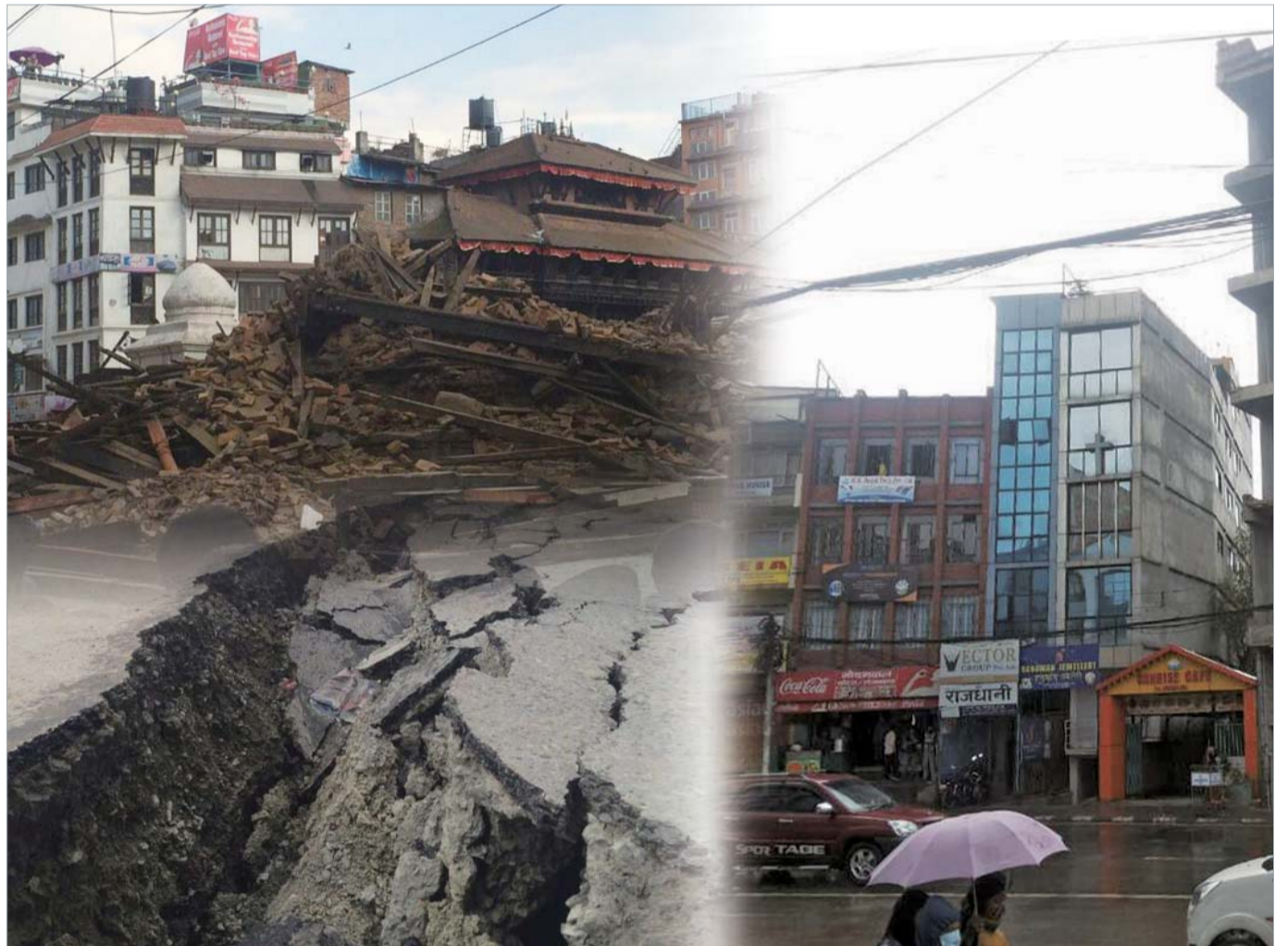
Maraming nasawi sa matinding lindol sa Nepal. Idalangin natin na huwag na nawang madagdagan pa ang pinsala at huwag na nawang magdusa ang mga tao sa takot at kaba. Bukod dito, nawa ay maging mga pinagpalang anak tayo ng Diyos na palagi Niyang iniingatan. Bigyan natin Siya ng kaluwalhatian.

Noong Hulyo 15, 2014, nagpakita din ng kapangyarihan ang Diyos sa isang