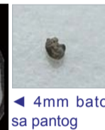
◀ 4mm bato sa pantog