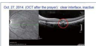
▶Pagkatapos idalangin: malinaw na interface, hindi aktibo