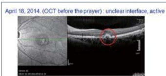
◀Bago idalangin: hindi malinaw na interface, aktibo