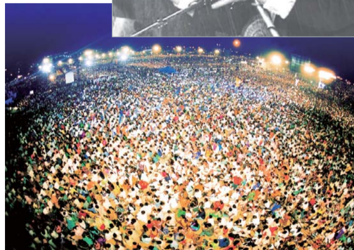
Ang krusada ng pagkakaisa sa India noong taong 2002 ay dinaluhan ng mahigit sa tatlong milyong tao. Habang isinasagawa ang krusada, nagtapos ang matinding tag-tuyot. Maraming tao ang gumaling at naging Cristiano.

Chennai mula sa Karnataka, isang lunsod sa malapit, pero sinabi nito na hindi na sila magbibigay ng tubig. Nakatakdang magsagawa ng protesta ang buong lunsod ng Chennai laban sa gobyerno dahil a problema sa tubig sa Oktubre 9. Pero habang nasa India si Dr. Lee sa loob ng isang linggo, napakadalas ng pag-ulan, marami silang naimbak na tubig.