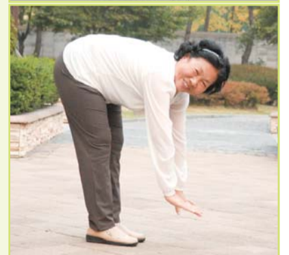
Pagkatapos ipanalangin, gumaling ang L4 at L5 na nakausing buto na umiipit sa mga ugat niya