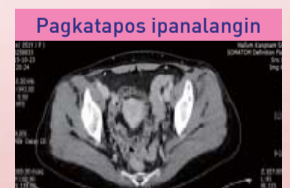
Nawala na ang bato