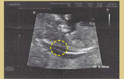
Pagkatapos ipanalangin Naging manipis ito 2mm na lang