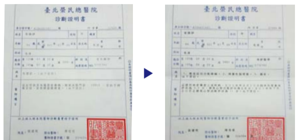
Bago idalangin, nasuring may sakit siya sa pagkamalilimutin (kaliwa) Pagkatapos ng panalangin, gumaling siya (kanan)