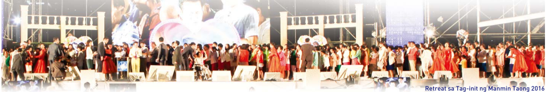
Retreat sa Tag-init ng Manmin Taong 2016

Sa Retreat sa Tag-init na idinadaos taun-taon tuwing simula ng buwan ng Agosto, maraming tao ang gumagaling mula sa maraming klaseng mga karamdaman tulad ng AIDS, depresyon, atake sa puso, pagdurugo ng utak, dementia, at pagkabulag. Basahin natin ang mga patotoo nila tungkol sa kanilang paggaling.