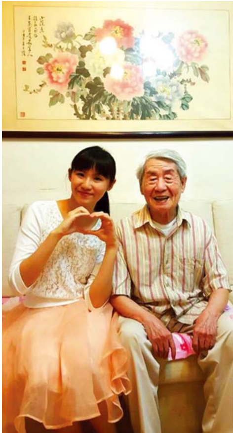
Kapatid Cheisusun, 35 taong gulang, Taiwan Manmin Church

Noong Pebrero 2013, may nagsama sa akin sa Taiwan Manmin Church. Natiyak ko na mayroong Langit at Impiyerno. Nagsimula akong manalangin at magbago. Naging masigasig ako sa pangangaral ng ebanghelyo lalo na sa pamilya ko. Naranasan ko din ang makapangyarihang pagkilos ng Diyos. Gumaling ang impeksyon ko sa mga mata.