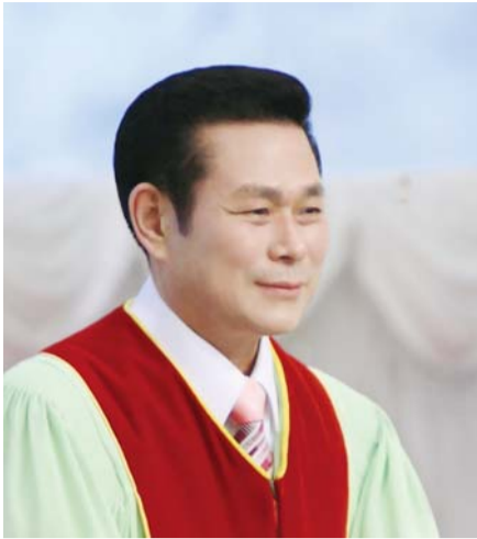
Punong Pastor Dr. Jaerock Lee