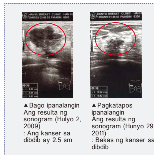
▲ Bago ipanalangin Ang resulta ng sonogram (Hulyo 2, 2009) : Ang kanser sa dibdib ay 2.5 sm ▲ Pagkatapos ipanalangin Ang resulta ng sonogram (Hunyo 29, 2011) : Bakas ng kanser sa dibdib

Noong nakaraang Mayo, dahil sa pananalig ay mas maliit na ang bukol ko pagkatapos makipagkamay kay Dr. Lee. Noong Hunyo 10, hindi ko na nasalat ang bukol pagkatapos maipanalangin sa unang sesyon ng Espesyal na Pagtitipon na may Banal na Pagpapagaling. Ipinanalangin ulit ako sa pangatlong sesyon noong Hunyo 24. Nagpasuri ulit ako noong Hunyo 29, at lumabas sa resulta na wala na ang kanser, subalit ang bakas nito ay naroon pa rin. Hallelujah!