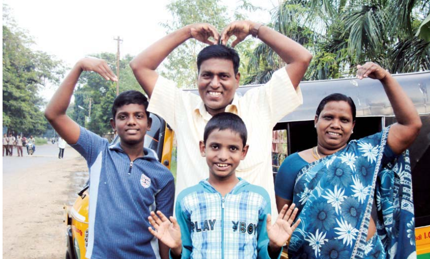
Pamilya ng Kapatid na Chittbabu

Nabalitaan ng napakaraming tao ang tungkol sa krusada. Nagsidalo ang mga Cristiano, gayundin ang mga hindi Cristiano. Ang bilang ng mga taong nagsidalo ay umabot sa tatlong milyon. Ito ang pinakamarami