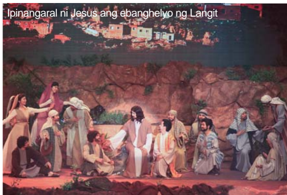
Ipinangaral ni Jesus ang ebanghelyo ng Langit