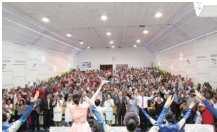
Ang oras ng papuri sa Seminar para sa mga Pastor sa Peru Manmin Church