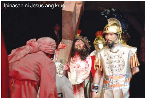
Ipinasan ni Jesus ang krus