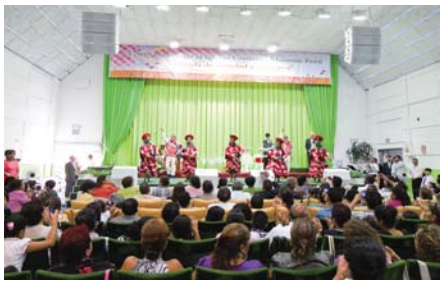
Pagsamba para sa Ika-6 na Anibersaryo ng Peru Manmin Church