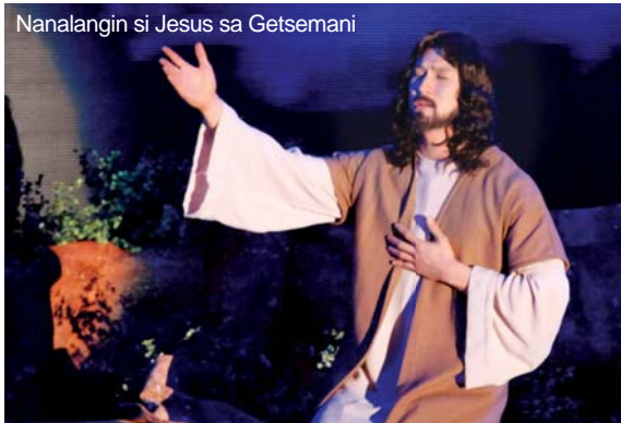
Nanalangin si Jesus sa Getsemani