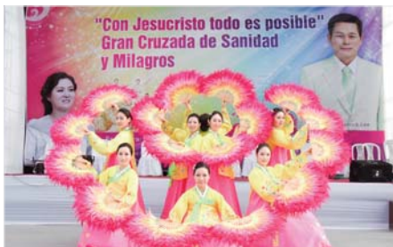
Ang Power Worship Dance Team sa Krusadang may Makapangyarihang Panyo sa Carabayo. Nakadagdag sa kasiyahan ang pagtatanghal nila.