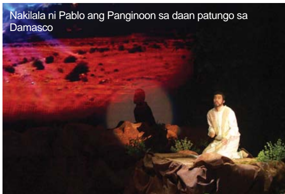
Nakilala ni Pablo ang Panginoon sa daan patungo sa Damasco

Sa Unang Tagpo ng palabas, ginunita ni apostol Pablo ang unang pagkakataong nakilala niya ang Panginoong Jesus noong patungo siya sa Damasco. At sa Ikalawang Tagpo, ginunita niya ang kapanganakan, ministeryo, pagdurusa, muling pagkabuhay, at pag-akyat sa langit ng Panginoon. Sa Ikatlong Tagpo, nagpasalamat at niluwalhati niya ang Diyos sa pag-alala niya sa naging buhay ng Panginoon. Narito ang ilang mga litrato ng pagtatanghal na puno ng pagpapala at emosyon.