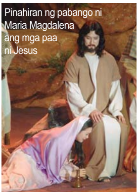
Pinahiran ng pabango ni Maria Magdalena ang mga paa ni Jesus