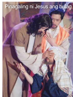
Pinagaling ni Jesus ang bulag