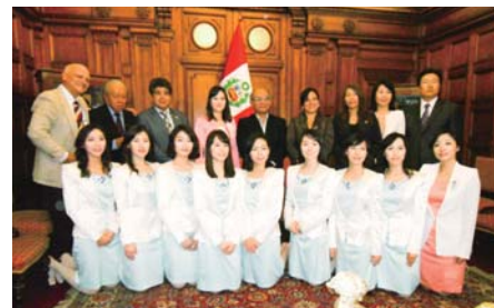
Pagbisita ng grupong pangmisyon sa Gusali ng National Assembly ng Peru