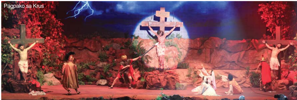
Pagpako sa Krus