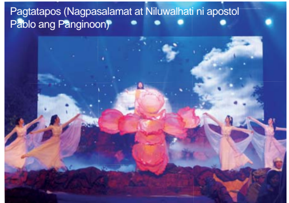
Pagtatapos (Nagpasalamat at Niluwalhati ni apostol Pablo ang Panginoon)