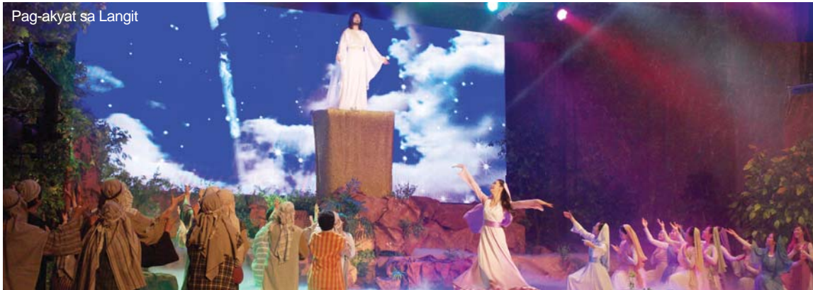
Pag-akyat sa Langit