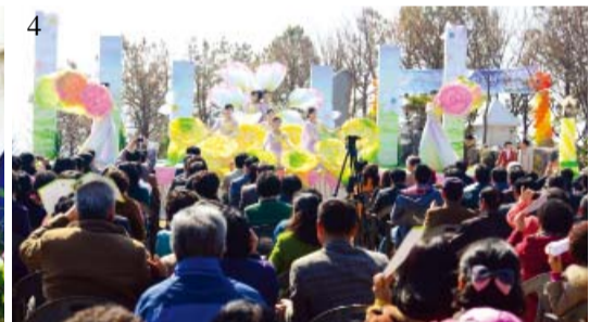
1: Pagkatapos ng pagdiriwang at pagtatanghal, naghandog ng pasasalamat at papuri sa Diyos ang mga bisita, sumayaw sila kasama ng mga nagatanghal sa Halaman ng Muan Sweet Water. 2: Ang Pagsamba at Pagpapasalamat para sa Ika-13 Anibersaryo ng Muan Sweet Water na may Kapangyarihan ng Diyos, dinaluhan ng maimpluwensyang mga bisita. 3: Nangangaral sa pagsamba si Pastor Dongcho Shin. 4: Ang pagtatanghal ng Crystal Singers at Sound of Light Chorus.

Mayroong tubig na nagpapatotoo na buhay ang Diyos at naghahatid ng pag-ibig Niya. Ito ay Muan Sweet Water – nagpapagaling at nagdudulot ng mga kasagutan kapag gagamitin nang may pananampalataya.