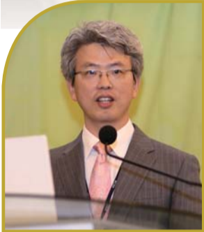
กรณีที่น่าเสนอโดย ดร. ชาง ยู ยาง แพทย์ผู้เชี่ยวชาญด้านรังสีวิทยา

ผมนำเสนอกรณีของการรักษาโรคมะเร็งรังไข่ โรคมะเร็งอวัยวะสืบและกระดูก และโรคมะเร็งในทรวงอกในการประชุมของหมอคริสเตียนนานาชาติครั้งที่ 1 ครั้งที่ 2 และครั้งที่ 6 กรณีต่างๆ เหล่านี้มีสิ่งหนึ่งที่เหมือนกัน นั่นคือ ผู้ป่วยไม่ได้พึ่งพึ่งยาแต่คนเหล่านี้ได้รับการรักษาให้หายด้วยความเชื่อในพระเจ้าและศรัทธา อธิษฐานของมีพลังอำนาจ ในการนี้ที่นำเสนอในการประชุมครั้งนี้ผู้ป่วยได้รับการรักษาให้หายจากโรคมะเร็ง โดยไม่มีการฉายรังสี