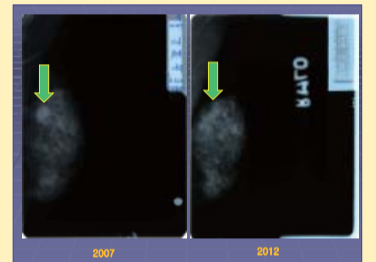
ก้อนเนื้อขนาด 2 เซนติเมตรจางหายไป