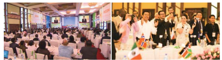
วีดิโอคำเทศนาของ ดร.แจร์อ็อก ลี ผู้ก่อตั้งและประธานบอร์ดของ WCDN ผู้เข้าร่วมประชุมสรรเสริญพระเจ้าด้วยความยินดี

แห่งหนึ่งในสหรัฐอเมริกา กล่าวว่า “เราออกอากาศการประชุมของ WCDN ทุกปีและได้รับการตอบรับจากผู้ชมเป็นอย่างดีผมเชื่อว่าผู้คนจำนวนมากจะได้รับความรอดเมื่อหมอบที่เข้าร่วมในการประชุมประกาศพระกิตติคุณและอธิษฐานเผื่อคนไข้ของคนในขณะที่เราตรวจโรคคนไข้” เครือข่ายหมอบคริสเตียนทั่วโลก (WCDN) ที่เป็นเจ้าภาพจัดการประชุมครั้งนี้คือหมอบคริสเตียนกลุ่มหนึ่งซึ่งมาจากหลากหลายคณะนิกายและมีสำนักงานใหญ่อยู่ในเกาหลีใต้ WCDN กำลังช่วยเหลือหมอบคริสเตียนทั่วโลกเชื่อมสัมพันธ์และสร้างมิตรภาพต่อกันและกันและมีความก้าวหน้าอย่างมากในแต่ละปีด้วยการเป็นเจ้าภาพจัดการประชุมบุคลากรทางการแพทย์คริสเตียนระดับนานาชาติทุกปีการนำเสนอกรณีการรักษาโรคด้วยฤทธิ์อำนาจของพระเจ้าและการกล่าวสุนทรพจน์เรื่องหน้าที่ของหมอบคริสเตียน WCDN กำลังวางแผนจัดการประชุมขึ้นที่ประเทศเม็กซิโกในปีหน้า