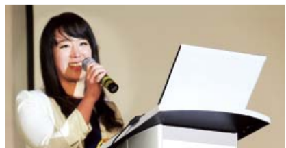
เธอกำลังเป็นพยานถึงผลการรักษาโรคของเธอในการประชุมของหมอคริสเตียนนานาชาติในประเทศเม็กซิโก