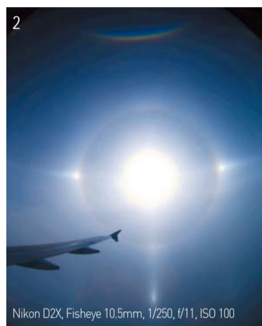
2 Nikon D2X, Fisheye 10.5mm, 1/250, f/11, ISO 100