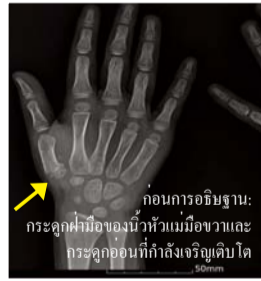
ก่อนการอธิษฐาน: กระดูกฝ่ามือของนิ้วหัวแม่มือและกระดูกอ่อนที่กำลังเจริญเติบโต