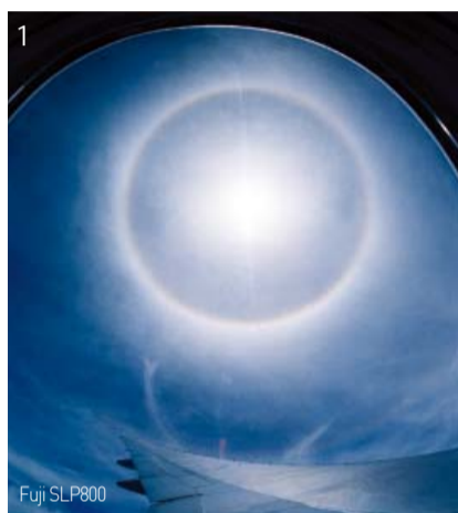
1 Fuji SLP800

อย่างไรก็ตามรุ้งปรากฏให้เห็นอย่างต่อเนื่องเหนือคริสตจักรมันมีนสาขามาก และคริสตจักรมันมีนเช่นทรัลทั้งในและนอก เกาหลีในช่วงการจัดงานของคริสตจักรและในช่วงการจัดกิจกรรมนอกสถานที่(เช่นการจัดค่ายภาคฤดูร้อนและการเดินทางไปทำพันธกิจ เป็นต้น) นับตั้งแต่คนเหล่านั้นเห็นรุ้งทรงกลมล้อมรอบดวงอาทิตย์เหนือคริสตจักรมันมีนเช่นทรัลด้วย