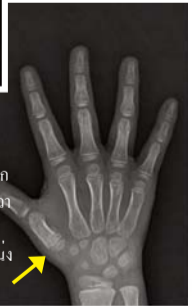
หลังการอธิษฐาน: กระดูกฝ่ามือของนิ้วหัวแม่มือและกระดูกอ่อนที่กำลังเจริญเติบโตอยู่ในตำแหน่งที่ถูกต้อง