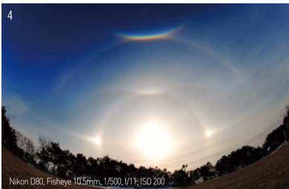
4 Nikon D80, Fisheye 10.5mm, 1/500, f/11, ISO 200

ในช่วงการเดินทางไปทำพันธกิจที่รัสเซียในเดือนมิถุนายน 2014 ของศจ.ซุนจิน ลี สมาชิกทีมพันธกิจมองเห็นรุ้งรูปทรงต่างๆ ซึ่ง รวมถึงรุ้งวงกลมสองเท่าขนาดใหญ่ รุ้งทรงกลม และรุ้งแนวตรง ในช่วงของการจัดประชุมผู้นำประจำปี 2014 จากวันที่ 30 มิถุนายนถึงวันที่ 2 กรกฎาคม รุ้งจำนวนมากปรากฏออกมาให้เห็นและทำให้สมาชิกหลายคนสัมผัสกับความรักของพระเจ้าผู้ ทรงสถิตอยู่กับคริสตจักรมันมีนตลอดเวลา