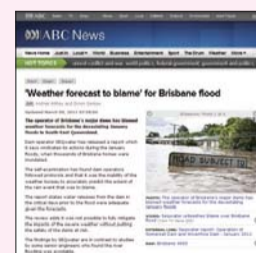
เกิดน้ำท่วมใหญ่ในรัฐควีนสแลนด์ ประเทศออสเตรเลียในเดือนมกราคม 2011 ซึ่งก่อให้เกิดความเสียหายอย่างมาก