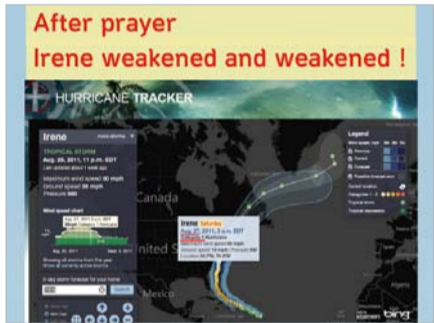
พายุเฮอริเคนไอรีนอ่อนตัวลงหลังจากการอธิษฐานของดร.ลี

ไม่กี่วันที่ก่อนดร.ลีอธิษฐานเพื่อเรื่องนี้ ในเวลาบ่ายสองโมงของวันศุกร์ในการแถลงข่าว นายเทศมนตรีของนครนิวยอร์ก นายไมเคิล บลูมเบิร์กเรียกร้องให้ประชาชนอพยพออกจากเมืองเป็นครั้งแรก แต่หลังจากดร.ลีอธิษฐานขอให้พายุเฮอริเคน จางหายไป พายุนั้นก็เริ่มอ่อนตัวลง ในวันอาทิตย์ ก่อนที่พายุจะถึงนครนิวยอร์ก พายุนั้นก็ถูกลดระดับลงจากพายุเฮอริเคน มาเป็นพายุโซนร้อนลูกหนึ่ง