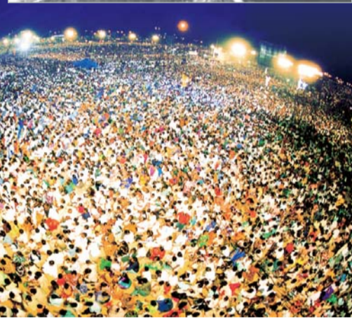
การประกาศครั้งใหญ่ในอินเดียปี 2002 มีผู้คนเข้าร่วมมากกว่าสามล้านคน ในช่วงเวลาการประกาศความแห้งแล้งที่รุนแรงได้รับการบรรเทา ผู้คนจำนวนมากหายโรคและกลับใจเป็นคริสเตียน