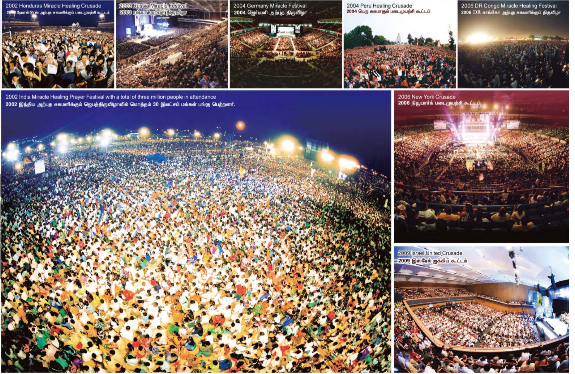
2002 Honduras Miracle Healing Crusade 2002 ஹோன்டூரஸ் அற்புத கருமளிக்கும் படைமுயற்சி கூட்டம்