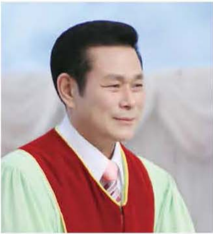
தலைமை போதகர். அறிவர். ஜேராக் வீ

“இயேசு பிரதியுத்தரமாக: ஒருவன் ஜலத்தினாலும் ஆவியினாலும் பிறவாவிட்டால் தேவனுடைய ராஜ்யத்தில் பிரவேசிக்கமாட்டான் என்று மெய்யாகவே மெய்யாகவே உனக்குச் சொல்லுகிறேன்” (யோவான் 3:5)