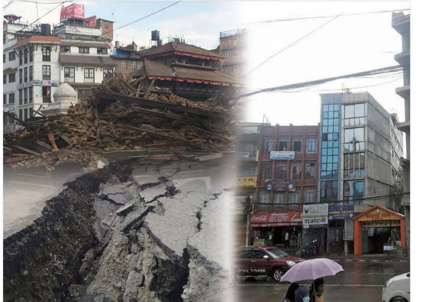
நேபாளத்தில் நிகழ்ந்த பெரிய நிலநடுக்கம் ஆயிரக்கணக்கான மக்களின் வாழ்வாதாரங்களை கேள்விக்குறியாக்கியது. அவ்விடத்தில் இனி எவ்வித பாதிப்பும் ஏற்படாமல் இருக்கவும், மக்கள் துரிதமாக அதிர்ச்சியிலிருந்து மீண்டுவரவும் நாம் ஜெபித்துக் கொள்வோம். கூடுதலாக, தேவனால் எப்பொழுதும் பாதுகாக்கப்பட்டு, அவருக்கு மகிமை செலுத்துகிற அவருடைய ஆசீர்வாதத்தின் பிள்ளைகளாக நாம் மாறுவோம்.

ஜூலை 15, 2014 அன்று, இதைப் போன்ற ஒரு சம்பவம் பிலிப்பைன்ஸில் இரவு நேரத்தில் நடந்தது. ராமசன் என்னும் சூறாவளி மணிக்கு 250கி.மீ வேகத்தில் சுழல் காற்றை வீசச் செய்து பிலிப்பைன்ஸ்