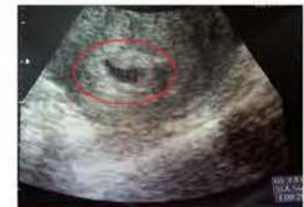
▲ ஜெபத்திற்கு பிறகு, இரத்த வீக்கமானது முற்றிலும் நீங்கி, சுகவானது அவளுடைய கருப்பையிலே இணைந் தது.

இந்த ஆச்சரியமான கிரியை அனுபவித்த பிறகு என்னுடைய கணவர் ஐந்து நாட்களாக தொடர்ந்து ஜெபிக்க ஆரம்பித்தார்; தேவனுடைய அன்புக்கும், கிருபைக்கும் அவர் நன்றி செலுத்துகிறார். நாங்கள் சகல நன்றிகளையும், மகிமையையும் தேவனுக்கே செலுத்துகிறோம்.