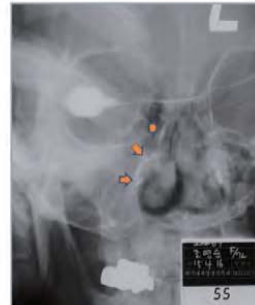
டெக்ரையோசிலிடோகிராஃபி: மூக்குக்கண்ணீர் சுரப்பிகளின் வலது நாளத்தின்மூலமாக நாசிக் குழியினுள் நீரானது இயல்பாக செல்லுகிறது.

அவளுடைய மூக்குக்கண்ணீர் சுரப்பியில் உண்டான அடைப்பு மருத்துவத்தினால் குணமாகவில்லை. மாறாக அது ஜெபத்தினால் சரியாக்கப்பட்டது. அது மிகவும் ஆச்சரியம். இந்த சாட்சியை அறிமுகப்படுத்திய பிறகு அநேக கிறிஸ்தவ மருத்துவர்கள் மகிழ்ச்சியினால் நிறைந்தவர்களாய் தேவனுக்கு மிகப் பெரிதான மகிமையை செலுத்தினர்.