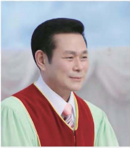
தலைமை போதகர், அறிவர், ஜேராக்கீ வீ

“நாம் பாவங்களுக்குச் செத்து, நீதிக்குப் பிழைத்திருக்கும்படிக்கு, அவர் தாமே தமது சரீரத்திலே நம்முடைய பாவங்களைச் சிலுவையின்மேல் சுமந்தார்; அவருடைய தழும்புகளால் குணமாளீர்கள்” (1பேதுரு 2:24)