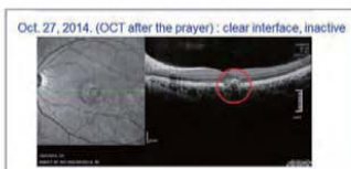
ஜெபத்திற்கு பின்பு : நாளங்களுக்கு இடையே தெளிவான நிலை