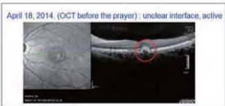
ஜெபத்திற்கு முன்பு : நாளங்களுக்கு இடையேயான தெளிவற்ற நிலை

ஆகஸ்டு 2014ல், அவள் அறிவர். ஜோராக் லீ அவர்களுடைய ஜெபத்தை மான்மின் கோடை சுற்றுலா முகாமில் முழு இருதயத்தோடு பெற்றுக்கொண்டாள். ஜெபத்தைப் பெற்ற பிறகு அவளுக்கு இருந்த எல்லா அறிகுறிகளும் நீங்கி அவள் எல்லாவற்றையும் தெளிவாக பார்க்க ஆரம்பித்தாள். அவளுடைய OCT சோதனையானது அவள் தேறினதை காண்பித்தது. மருத்துவர்கள் பரிசோதனை முடிவை கண்டு ஆச்சரியமடைந்தனர்; அவர்கள் CNV-யானது anti VEGF மருந்தைப் பயன்படுத்தாமல் குணமானது ஒரு அதிசயம் என்றனர்.