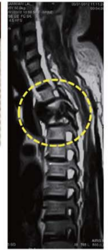
அவர் சுகமடைவதற்கு முன்பு எடுக்கப்பட்ட MRI: இரண்டாவது மற்றும் மூன்றாவது முதுகு தண்டுவட முள்ளெலும்புகள் முதுகெலும்பு காசநோயினால் சேதமடைந்திருந்தன.