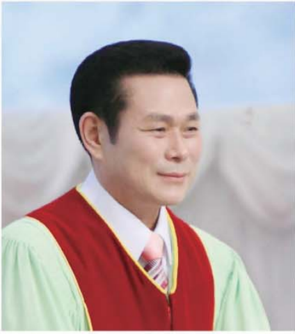
தலைமை போதகர். அர்வார். ஜேராஜ் ௧6

“நம்முடைய மீறுதல்களினிமித்தம் அவர் காயப்பட்டு, நம்முடைய அக்கிரமங்களினிமித்தம் அவர் நொறுக்கப்பட்டார்; நமக்குச் சமாதானத்தை உண்டாக்கும் ஆக்கினை அவர்மேல் வந்தது; அவருடைய தழும்புகளால் குணமாகிறோம்” (ஏசாயா 53:5).