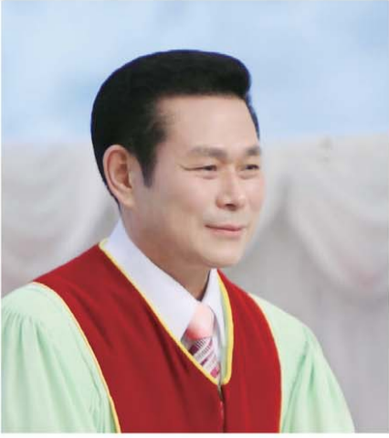
தலைமை போதகர் அறிவர். ஜேராக் வீ