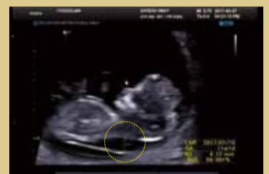
▲接受禱告前：胎兒頸部透明帶厚度為4.12公分，疑似唐氏症或其他遺傳性疾病。