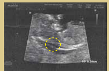
▲接受禱告後：4.12公分的胎兒頸部透明帶厚度減到2毫米。