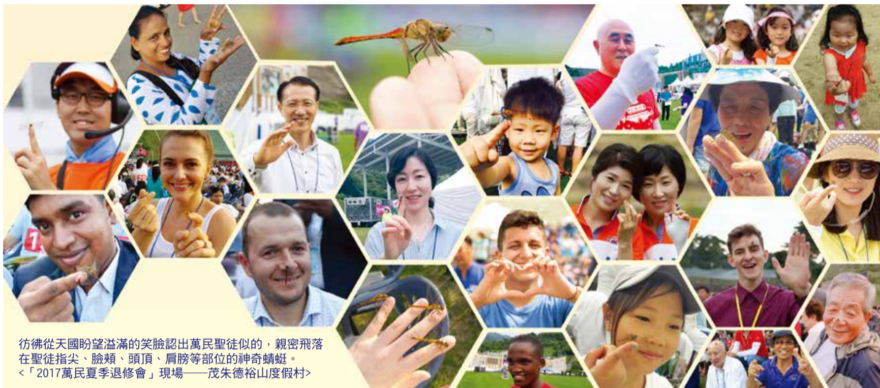
彷彿從天國盼望溢滿的笑臉認出萬民聖徒似的，親密飛落在聖徒指尖、臉頰、頭頂、肩膀等部位的神奇蜻蜓。 <「2017萬民夏季退修會」現場——茂朱德裕山度假村>