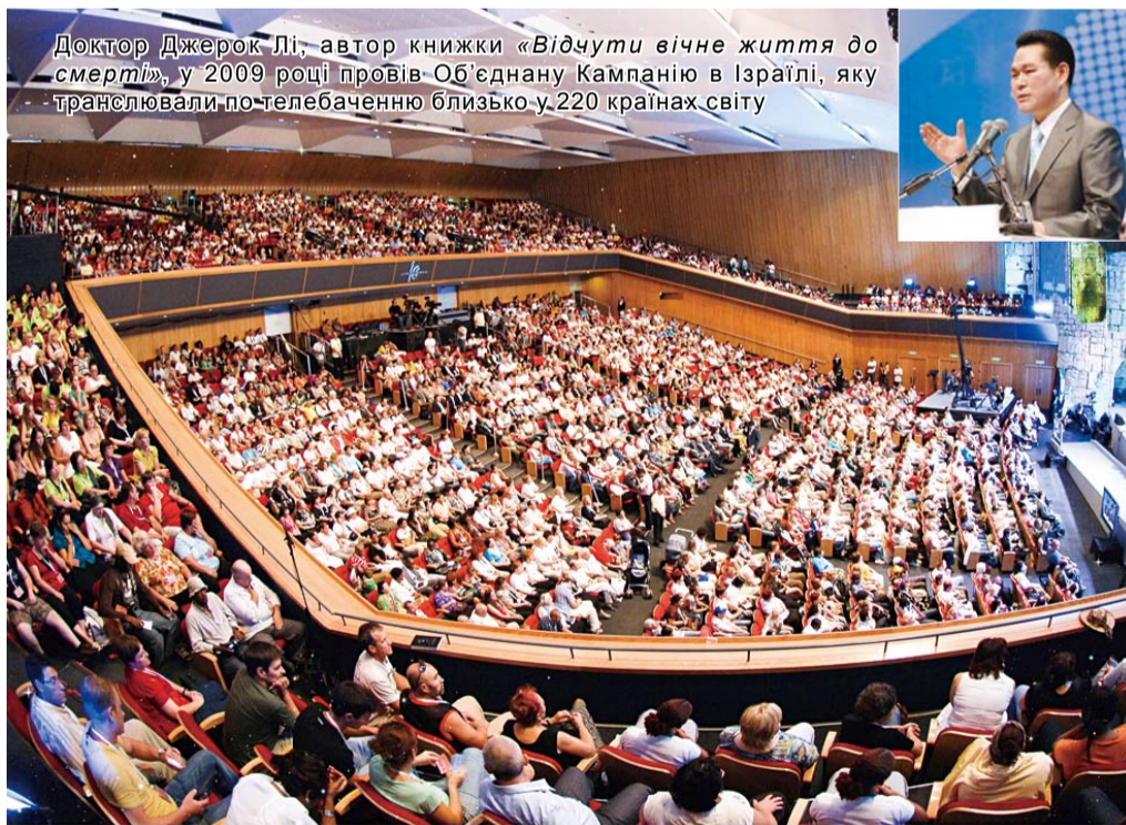
Доктор Джерок Лі, автор книжки «Відчутти вічне життя до смерті», у 2009 році провів Об'єднану Кампанію в Ізраїлі, яку транслювали по телебаченню близько у 220 країнах світу

«Арабське видання цієї книжки побачило світ у Лівії, давши можливість багатьом громадянам прочитати її. Це послання благословення, яке несе у собі неймовірні емоції і надію. Сподіваюся, що книжки доктора Джерок Лі будуть перекладені і видані арабською, вірменською та іранською мовами і поширяться на Середньому Сході».