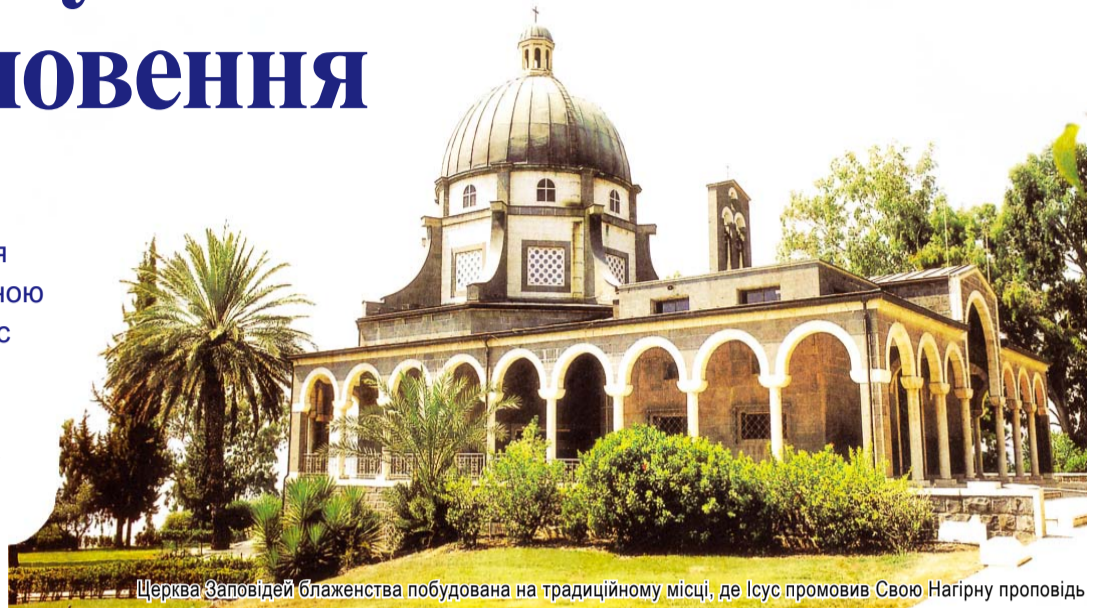
Церква Заповідей блаженства побудована на традиційному місці, де Ісус промовив Свою Нагірну проповідь

На вершині гори Ісус проповідував дорогоцінне послання перед безліччю людей. Те послання називається «Нагірною проповіддю». Людям, які скоро зникнуть, наче туман, Ісус розповідав про вічне благословення, а саме, про істинні благословення, які чекають на них у Небесному Царстві. Таким посланням є «Заповіді блаженства». Це є для нас дороговказом, щоби ми могли перевіряти себе і увійшли у місце, де перебуває Божий престол – у Новий Єрусалим. Давайте поговоримо про це!