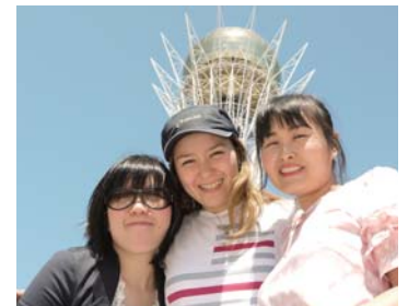
Семінар МУЦМ (Місіонерського учбового центру Манмін) в Казахстані. Сестра Ширель та учасники із Кореї

Після завершення однорічного теологічного навчання в Ізраїлі я повернулася в Казахстан, взявши з собою декілька книжок доктора Джерок Лі. Я провела семінар «Міра віри» для служителів церкви. Вони були глибоко зворушені. Багато членів церкви почали читати книжки доктора Лі і намагалися жити так, як там було написано. Вони відчули зміни у житті. Свідectва про зцілення і благословення текли потоком.