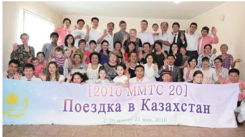
Члени церкви «Шлях Духу» міста Алмати та студенти Місіонерського учбового центру Манмін (МУЦМ) під час 29-ої учбової подорожі.

Ми за все дякуємо і славимо Бога, Який благословив нас знайомством з доктором Джерок Лі, який дійсно любить Бога, повністю присвячує себе Йому і служить Йому як наш духовний наставник.