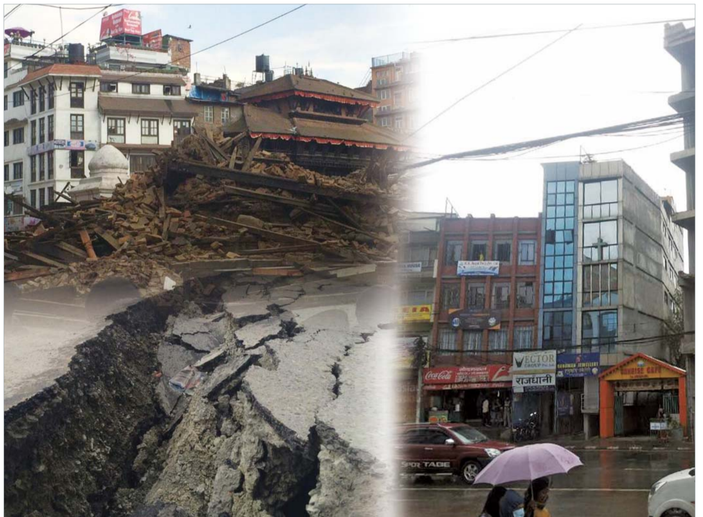
Величезний землетрус у Непалі забрав життя великої кількості людей. Давайте молитися про те, щоби більше не сталося катастроф, і щоби люди не страждали від травм, спричинених катастрофами. Крім того, давайте станемо благословенними Богом дітьми, яких завжди захищає Бог, і прославимо Його.