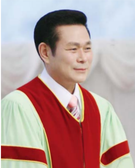
Старший пастор доктор Джерок Лі

Перелюб – це добровільний сексуальний зв'язок між одруженим чоловіком або заміжньою жінкою та іншою особою, яка не є законним чоловіком, або дружиною. У минулому це вважалося тяжким гріхом. Але у наш час сумління людей стало таким закляким, що вони не відчують гріха. В результаті вони легко грішать.