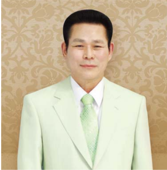
بزرگ پاسٹر ڈاکٹر بے راک لی

مسیح میں عزیز بھائی اور بہنو، میں خداوند کے نام میں دعا کرتا ہوں کہ اس پیغام کے وسیلہ سے آپ تصور کر سکیں کہ خدا پر ایمان کا اقرار کرنے کے باوجود ممکن ہے کہ کوئی شخص نجات نہ پا سکے اور سب کیلئے ضرور ہے کہ وہ موت کی اس راہ پر صارف رہیں اور سیدھی راہ اختیار کر کے بحفاظت آسمان تک پہنچیں۔