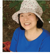
سینئر ڈیکونس ینگنم پارک (عمر ۶۲، ۱۲ ویں پیرش)