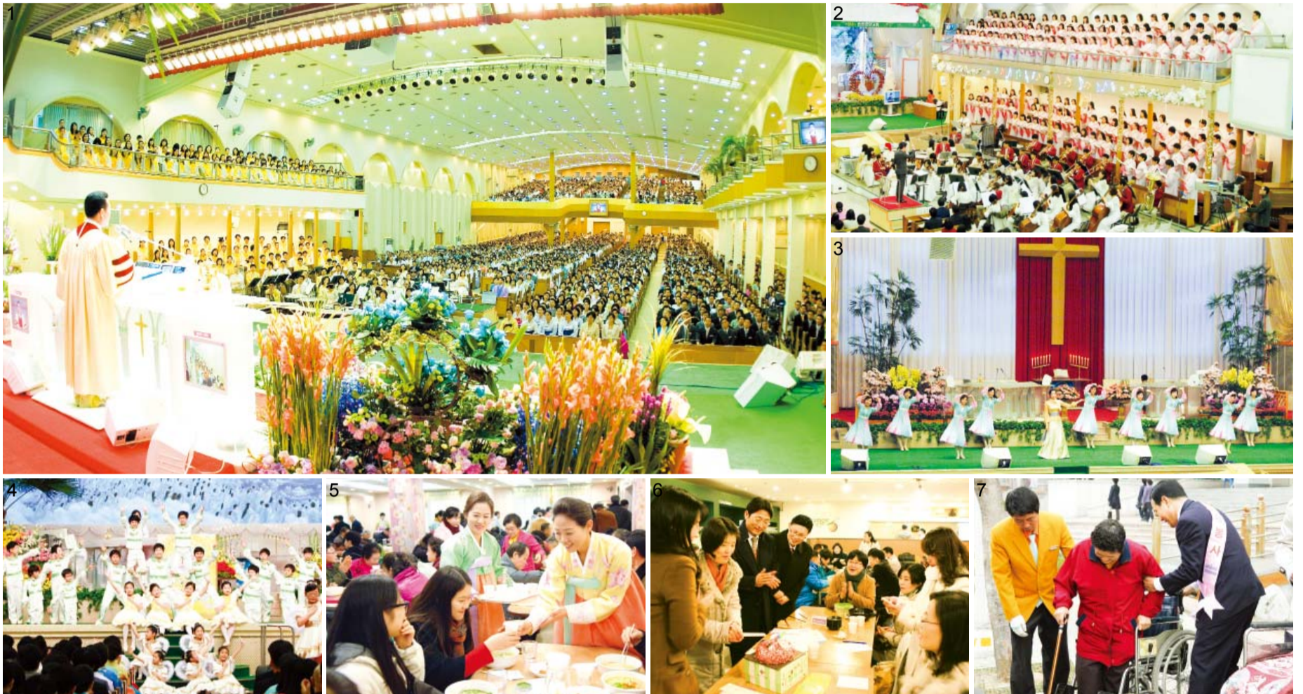
Hình 1: Lễ Sáng Chúa Nhật Hình 2: Ca đoàn và Ban nhạc Nissi Hình 3: Ngợi khen sơ khởi trước Lễ tối Chủ Nhật. Hình 4: Trình diễn đặt biệt của Ca Đoàn Đá Trắng Hình 5: Ăn trưa cho những người mới đến Hình 6: Các buổi nhóm tế bào Hình 7: Đội Tình Nguyện Manmin, giúp đỡ những người trên xe lăn

Những phước hạnh và bình an thật sự có được qua việc giữ ngày của Chúa là điều mà sự giàu có, sự tôn trọng, danh tiếng hay bất kỳ điều gì trên đời này đều không thể sánh được.