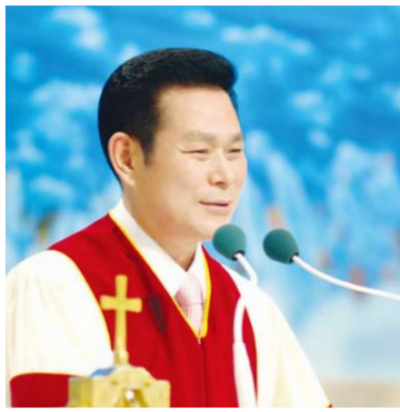
Mục Sư Trưởng Tiến Sĩ Jaerock Lee