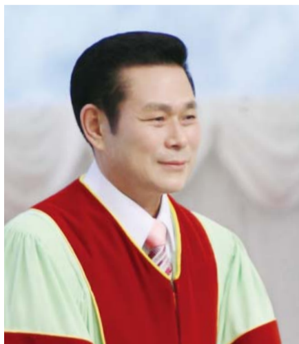
Mục sư Tiến sĩ Jaerock Lee

“Chúng ta đã biết và tin sự yêu thương của Đức Chúa Trời đối với chúng ta. Đức Chúa Trời tức là sự yêu thương, ai ở trong sự yêu thương, là ở trong Đức Chúa Trời, và Đức Chúa Trời ở trong người ấy” (1 Giăng 4:16).