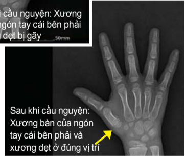
Sau khi cầu nguyện: Xương bàn của ngón tay cái bên phải và xương dẹt ở đúng vị trí