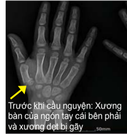
Trước khi cầu nguyện: Xương bàn của ngón tay cái bên phải và xương dẹt bị gãy