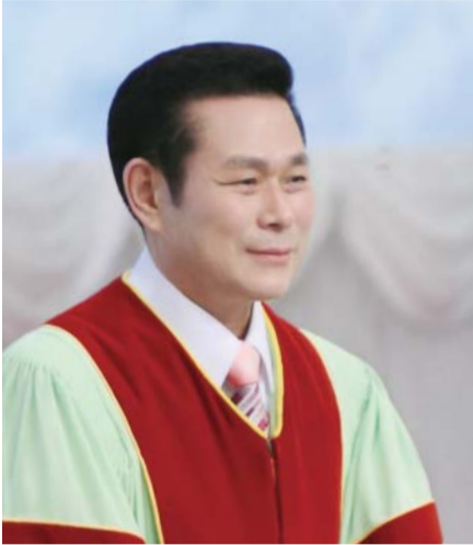
Mục sư Tiến sĩ Jaerock Lee

“Bấy giờ, Đức Chúa Trời phán mọi lời này, rằng: Ta là Giê-hô-va Đức Chúa Trời người, đã rút người ra khỏi xứ Ê-díp-tô, là nhà nô lệ. Trước mặt ta, người chớ có các thần khác” (Xuất Ê-díp-tô ký 20:1-3).