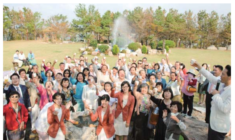
Chuyến thăm của ông đến Nước Ngọt Muan Site, nơi quyền năng Đức Chúa Trời được bày tỏ (Muan, tỉnh Jeonnam tại Hàn Quốc)