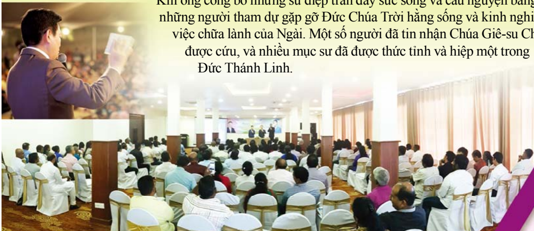
▲ Hội Thảo Mục sư Sri Lanka (ngày 28 tháng 11)

Khi ông công bố những sứ điệp tràn đầy sức sống và cầu nguyện bằng khăn tay, những người tham dự gặp gỡ Đức Chúa Trời hằng sống và kinh nghiệm các công việc chữa lành của Ngài. Một số người đã tin nhận Chúa Giê-su Christ và đã được cứu, và nhiều mục sư đã được thức tỉnh và hiệp một trong Đức Thánh Linh.