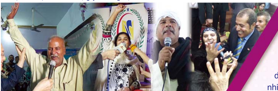
▼ Hội Nghị Chữa Lành với Khăn Tay tại Sri Lanka (ngày 29 tháng 11)