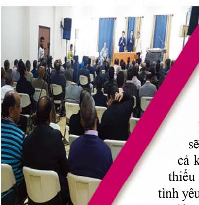
▼ Hội Nghị Chữa Lành với Khăn Tay tại Ai Cập (ngày 2 tháng 12)