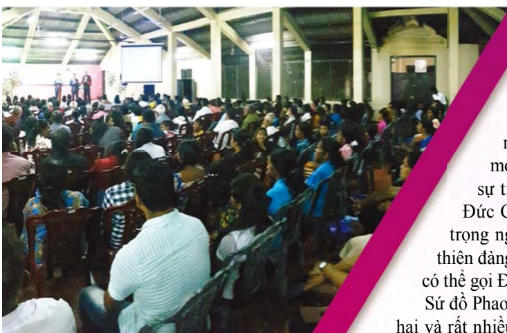
▼ Hội Thảo Mục sư Ai Cập (ngày 1 tháng 12)