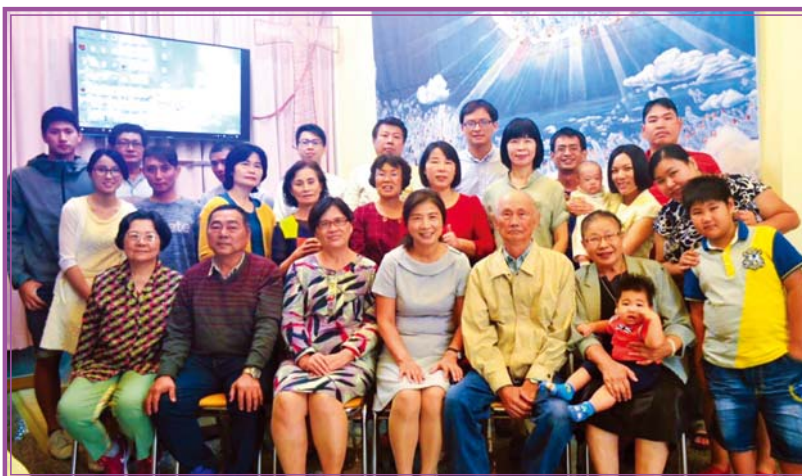
Nhà thờ Xin Zhan Manmin tại Đài Loan

Hơn nữa, chúng tôi đã từng dâng lễ bái trong gia đình nhưng hiện nay chúng tôi có một nhà thờ vì Đức Chúa Trời đã ban cho các thành viên của tôi những phước lành về tài chính. Tôi đã được đổi mới bằng lời sự sống, và nhiều công việc chữa lành và phước lành tràn ngập trong nhà thờ tôi. Tôi là một mục sư thực sự được phước. Hallelujah!