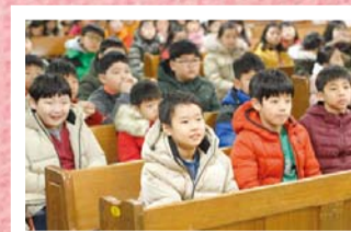
Những giấc mơ và Khải tượng của tôi, "Nhân sự Lê-vi (nhân sự trọn thời gian của nhà thờ) làm gì?"