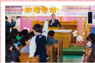
Để tâm linh được tinh thức trong thời sau rốt! Cầu nguyện trong sự đầy trọn!

Từ ngày 22 đến 24 tháng 2, 'Vision School for Children 2018' được thực hiện để gieo những ước mơ và Khải tượng vào lòng con trẻ của Manmin.