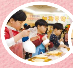
Công thức riêng của tôi, "Chiếc Bánh Đáng Yêu"