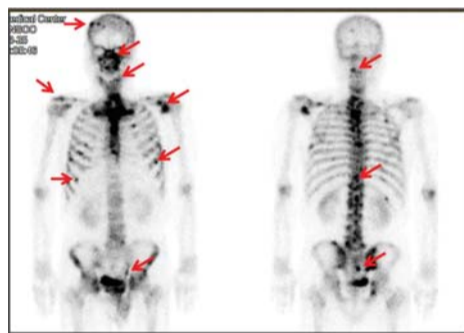
До молитвы: рак носоглотки распространяется на кости черепа, лопатки, ребра, позвоночник, позвонковую кость и копчик