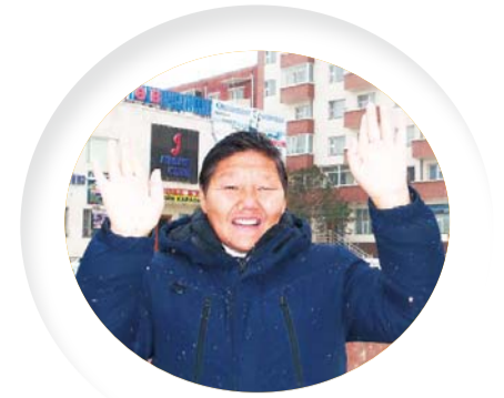
Брат Кекусуре (59 лет), церковь Монголия Манмин