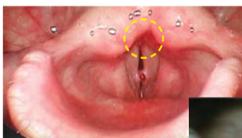
Полипы на голосовых связках справа, возникшие из-за чрезмерной нагрузки

Две недели спустя, почувствовав, что у меня в горле появилась какая-то жидкость, я побежал в ванную. Сплюнув, я увидел, что это кровь. Я ожидал, что это и есть ответ от Бога, и пошел в госпиталь. Мой врач сказал: «Но это практически невозможно, полипы не могут отрываться сами по себе...» – и добавил к сказанному, что мне повезло. Полипы на моих голосовых связках исчезли!