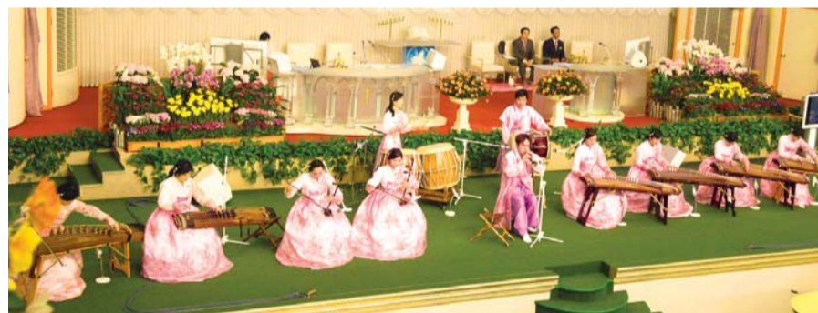
Группа традиционной корейской музыки «Серем» во время прославления

Я благодарю Бога, Который дал мне это великое благословение, а также спас меня, шедшего по пути к гибели, и дал мне надежду на Новый Иерусалим. Аллилуйя!