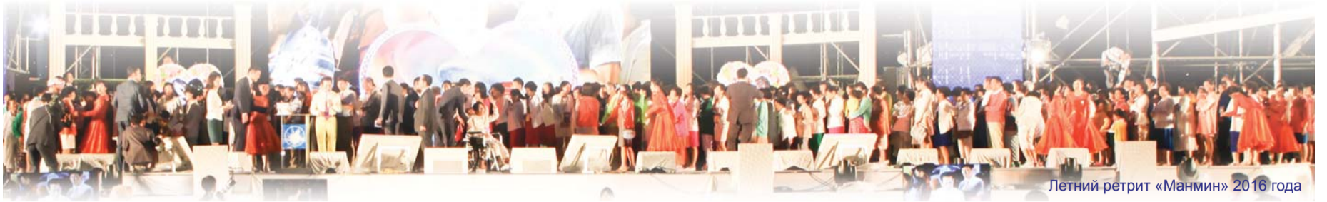
Летний ретрит «Манмин» 2016 года

Во время летнего ретрита «Манмин», который проводится каждый год в начале августа, многие люди исцеляются от разного рода болезней, включая СПИД, депрессию, инфаркт, кровоизлияние в мозг, деменцию и слепоту. Давайте познакомимся со свидетельствами тех, кто получил исцеление.