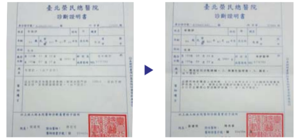
До молитвы – диагноз «деменция» (слева) После молитвы – отсутствие симптомов клинической деменции (справа)