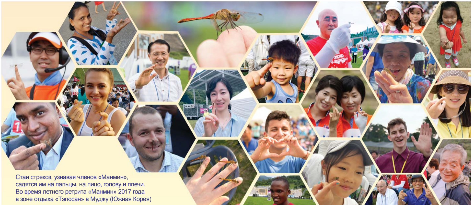
Стаи стрекоз, узнавая членов «Манмин», садятся им на пальцы, на лицо, голову и плечи. Во время летнего ретрита «Манмин» 2017 года в зоне отдыха «Тэгусан» в Муджу (Южная Корея)