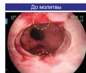
▲ кровотечение и воспаление в промежуточной области между желудком и пищеводом.

30 декабря 2017 года, после пятничного всенощного служения,