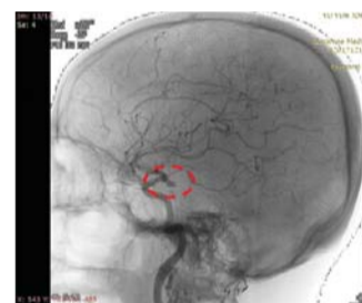
▲ Перед молитвой: правая передняя мозговая артерия На исходном снимке аневризма.