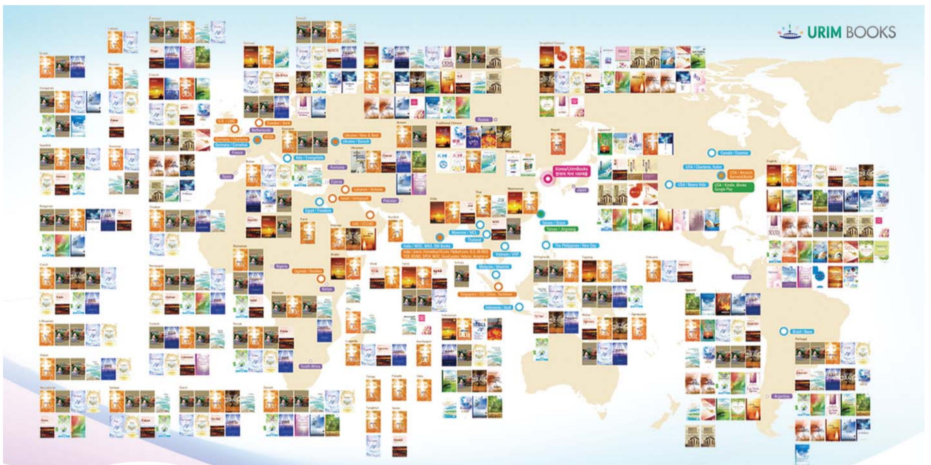
Иллюстрированный отчет о литературно-публицистическом служении для людей всего мира