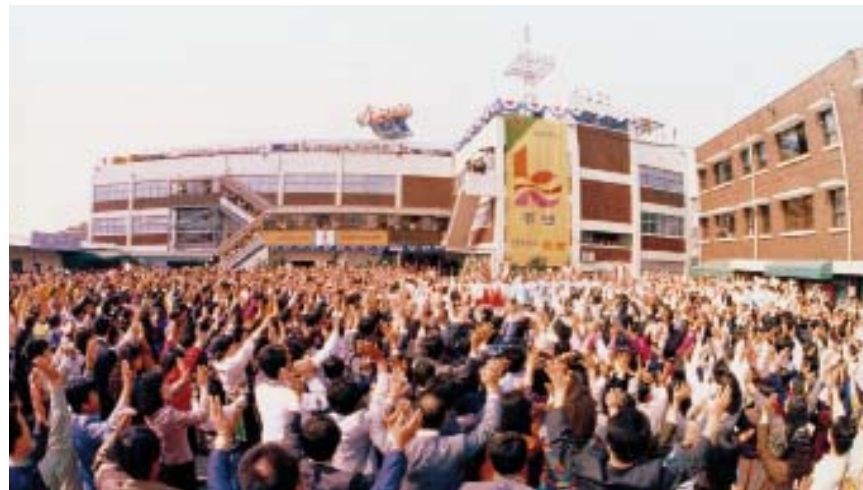
Всего через 10 лет после своего основания, Манмин стала одной из ведущих церквей и насчитывала 17 тысяч зарегистрированных членов. Перед церковью состоялось празднование X Юбилея церкви (11 октября 1992 года).