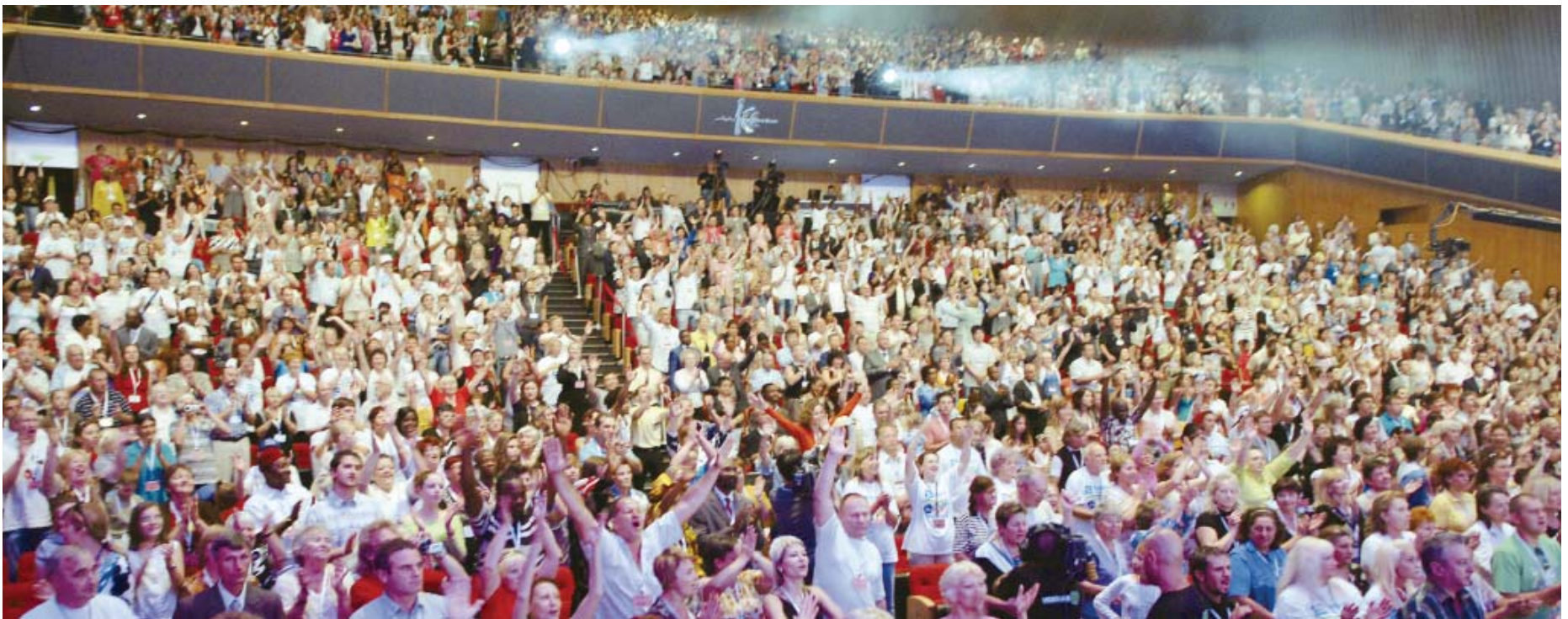
Христиане и лидеры церквей из 36 стран приветствуют группу прославления Манмин аплодисментами.

Поток удивительных свидетельств продолжается после завершения Объединенного крусеяда 2009 года в Израиле с д-ром Джей Роком Ли