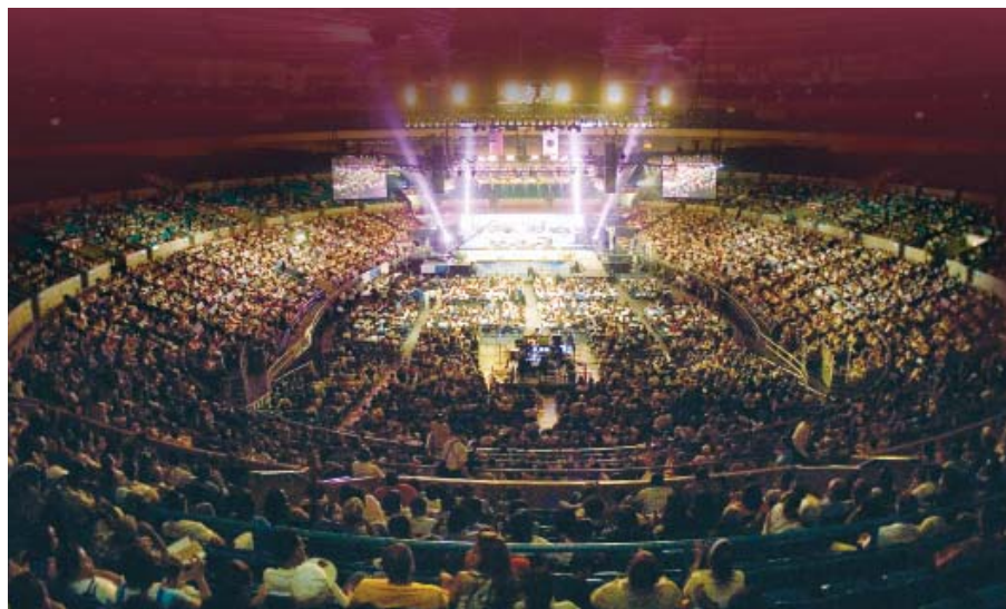
Крусеид в Нью-Йорке прошел в 2006 году и транслировался в двухстах странах (27-29 июля, Мэдисон Сквер Гарден)

провозглашен католиком на Филиппинах: крусеид 2001 года «Искра Возрождения». Крусеид «Чудо Исцеления» 2002 года в Гондурасе принес вихрь Святого Духа во всю Центральную Америку. Фестиваль «Чудо Исцеления» 2002 года в Индии