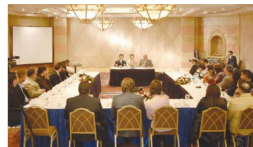
Встреча с пасторами в Вифлееме во время третьего визита в Израиль

провидение Бога об Израиле и попросил помочь распространить благую весть в этой стране. На этой встрече с пасторами стали вырисовываться планы следующего визита. Время, проведенное нами вместе было наполнено глубоким смыслом: мы начали работать вместе, в одной команде».