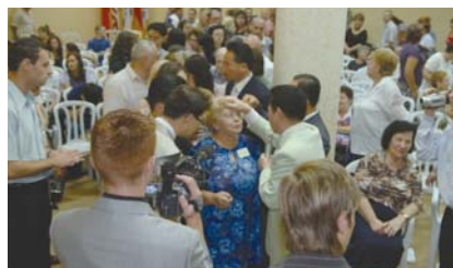
Молитва о больных на встрече исцеления в церкви «Дух Жизни», Назарет

«В среду, на следующий день после моего прибытия в Израиль, я провел вечернее собрание в церкви «Дух Жизни» в Назарете. Это церковь связана с Манмин. Произошло