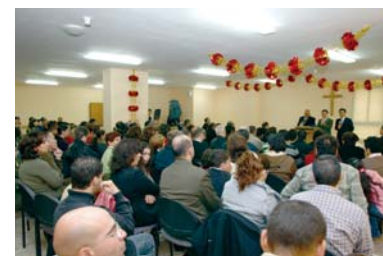
Празднование Рождества в Вифлееме, где родился Иисус

«Это путешествие было особенным. На это Рождество, Спаситель всего человечества, Иисус Христос, был еще раз возведен не только на земле, но и в духовном мире. В этом был глубокий духовный смысл. Как ненавистно это было врагу дьяволу! Ему еще раз пришлось признать свое поражение. Это была удивительная возможность воздать славу имени Бога-Отца и имени Господа по всей вселенной».