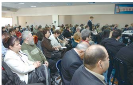
Первый семинар пасторов в Ашдоде

«Во время нашего первого визита в Израиль в 2007 году я заметил, что большинство пасторов работали по выходным и совершали служение в церквях только по субботам. Им было нелегко достичь единения, и еще сложнее – запланировать христианскую встречу, провести ее и благовествовать вместе, в одной команде. Но несколько пасторов, которые доверились мне и пожелали объединиться с церковью Манмин, стали главными организаторами пасторской ассамблеи «Хрустальный форум». Пасторы этой организации не только желают сотрудничать друг с другом, но и стремятся быть одной семьей в Боге».