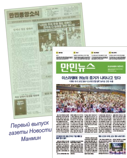
Первый выпуск газеты Новости Манмин

С ростом числа членов церкви и ростом зарубежных миссий, потребность в новостях увеличивается.