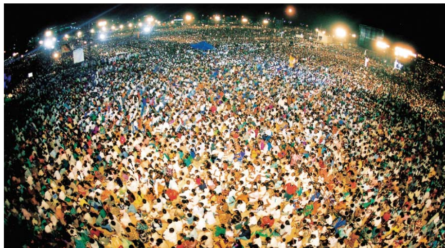
В 2002 году на фестиваль «Чудо Исцеления» в Индии пришло три миллиона человек (10-13 октября, Марина Бич)

собрал более трех миллионов, и огромное количество исцеленных приняли христианство. Фестиваль «Чудо Исцеления» 2003 года в России, был официально включен в празднование 300-летия Санкт-Петербурга. Теле-трансляция велась на 150 стран по всему миру. «Фестиваль Исцелений» 2004 года в Германии принес Евангелие Святости в Европу. «Крусеид Исцелений» 2004 года в Перу был поддержан правительством, прессой и христианскими организациями. Крусеид «Чудо Исцеления» 2006 года в Демократической Республике Конго получил поддержку правительства и собрал более 700 тысяч участников. Бесчисленное множество библейских чудес привело многих воздать славу Богу. Крусеид в Нью-Йорке 2006 года прошел во всемирно известном зале Мэдисон Сквер Гарден. Слепые обрели зрение, глухим вернулся