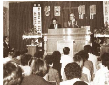
Торжественное основание церкви (10 октября 1982 года)

приходило так много народа, что нельзя было повернуться.