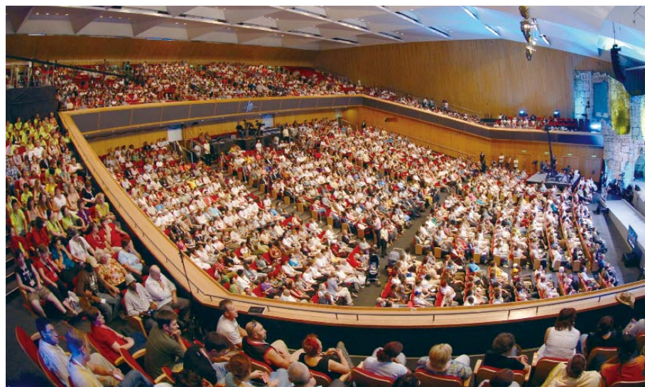
Объединенный крусейд в Израиле, «Международный межкультурный фестиваль 2009 года», транслировался в 220 странах, на 8 языках, через 33 теле станции.

«Этот семинар собрал вместе пасторов со всех концов израильской земли. Моя проповедь переводилась на четыре языка: английский, французский, иврит и русский. Когда собравшиеся пасторы услышали проповедь «Духовное толкование сложных стихов», они получили великое благословение