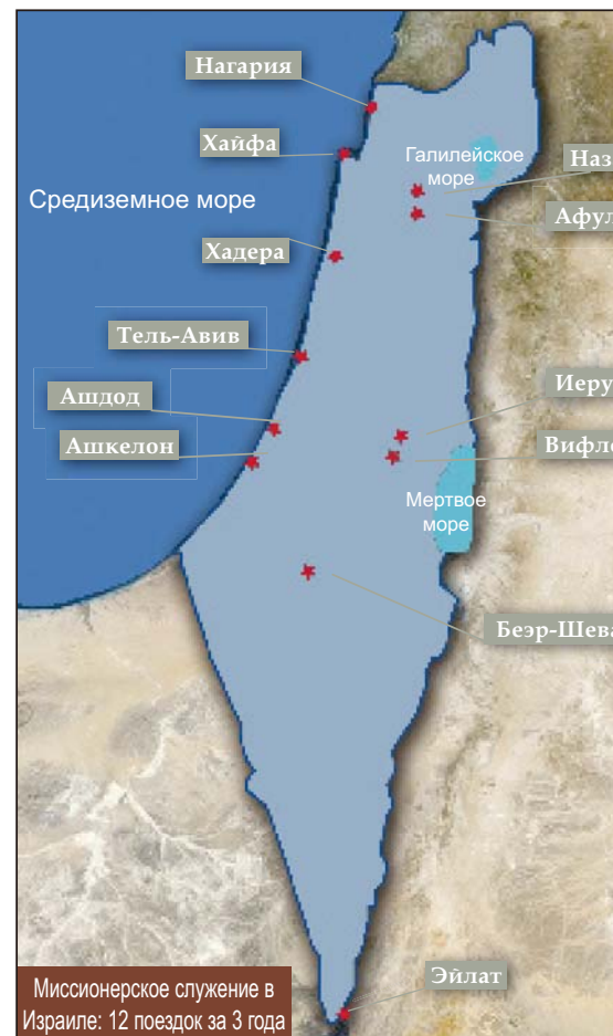
Миссионерское служение в Израиле: 12 поездок за 3 года

«В последний понедельник нашего визита в Израиль мы провели встречу пасторов, и это было основной целью второй поездки в Израиль. Я объяснил пасторам В Тел-Авиве