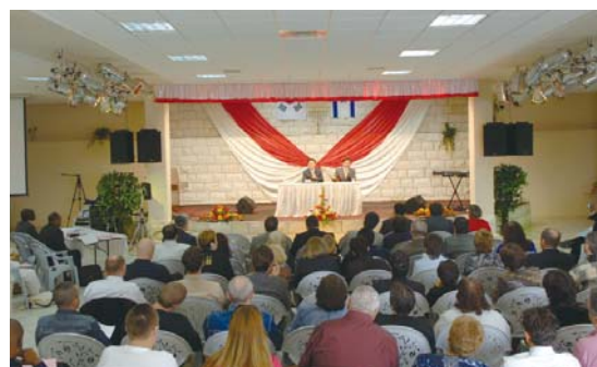
Второй семинар пасторов в Назарете

* Вышеприведенный текст представляет собой выдержки из проповедей д-ра Джей Рока Ли о миссии в Израиле, зачитанных на воскресных собраниях с 5 августа по 20 сентября 2009 года (прим. ред.)