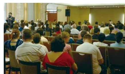
Третий семинар пасторов в Иерусалиме

«Когда пасторский семинар подошел к концу, и я уже был готов сесть в автобус и вернуться в гостиницу, ко мне подошел пастор. Он попросил меня задержаться на несколько минут. Он сказал, что со мной хочет встретиться верующий из его церкви, больной раком. Я искренне, всем сердцем помолился об этом человеке, и он исцелился от рака. Видя, что через меня Бог являет Свою великую силу, израильские пасторы обрели истинную веру и сердечно захотели сотрудничать со мной ради благовестия в Израиле. Еще одно событие подняло их веру на более высокий уровень. Они стали свидетелями деяний Бога через платки, над которыми я возлагал руки с молитвой, чтобы Бог явил Свою силу» (Деяния, 19:11-12).