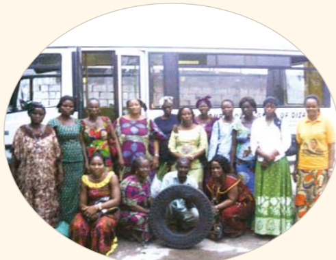
Члены церкви Манмин Киншаса, получившие защиту во время аварии, когда у их микроавтобуса прокололись шины