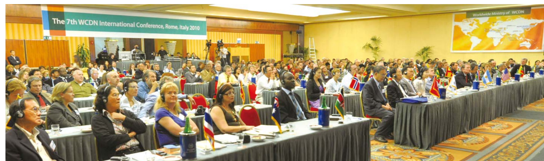
21-го и 22 мая 2010 года VII Международная христианская медицинская конференция на тему «Духовность и медицина» прошла в конференц-зале отеля «Шератон» в Риме (Италия).

На VII Международной христианской медицинской конференции в Риме собрались 270 делегатов из 40 стран